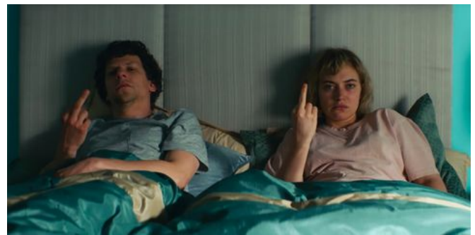
Crítica de 'Vivarium'