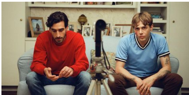
Crítica de 'Matthias & Maxime'