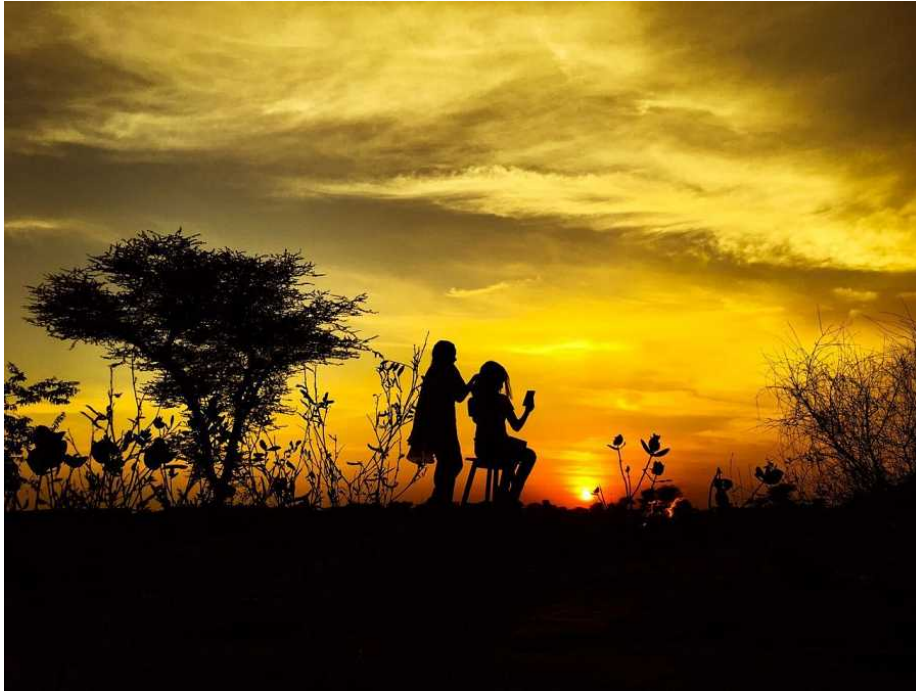
Fotograma de 'La cinta de Álex'