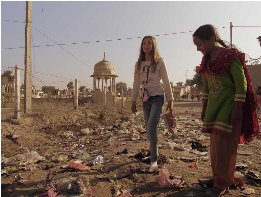
Fotograma de 'La cinta de Álex'

actor-. Empezó siendo una niña y le resultaba complicado repetir las tomas 15 veces , porque se cansaba, e Irene y yo teníamos que intentar hacer algo diferente cada vez para mantener su concentración. Pero es muy competitiva y aprendió el oficio enseñada. Al final competía conmigo en cada escena, lo que generó muy buena química entre los dos y dió mucha credibilidad a esa relación de padre e hija".