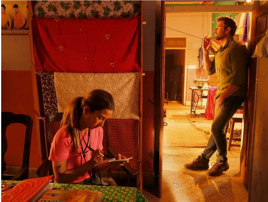
Fotograma de 'La cinta de Álex'

valentía por parte de la distribuidora y de la directora -añade Fernando-. Pero es una gran noticia y es muy necesario para que la gente recupere la inercia de ir a los cines"