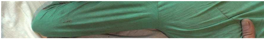
Fotograma de 'La cinta de Álex'