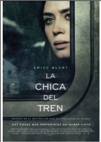
Cartel de la película La chica del tren , basada en la novela homónima de Paula Hawkins.

Ni siquiera el desenlace, tan gore y catárquico del original literario es recogido en la cinta, con lo que los fans del libro se quedarán desencantados y el resto de los espectadores francamente indiferentes. Tan inverosímil es el cambio moral de la protagonista como las motivaciones de las otras dos mujeres de la trama. Como consecuencia, la representatividad del trio femenino de la novela homónima –la ex abandonada, la esposa abnegada y la mujer fatal- queda perdida en un filme insustancial.