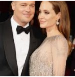
Brad Pitt y Angelina Jolie, juntos de nuevo en una película