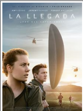
Cartel de La llegada, de Denis Villeneuve