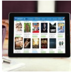
Las mejores 5 apps para ver películas en tu Tablet o Smartphone