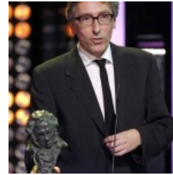
“Vivir es fácil con los ojos cerrados” gran triunfadora de los premios Goya