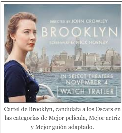
Cartel de Brooklyn, candidata a los Oscars en las categorías de Mejor película, Mejor actriz y Mejor guión adaptado.

POR IRENE ZOE ALAMEDA , 22 FEBRERO, 2016