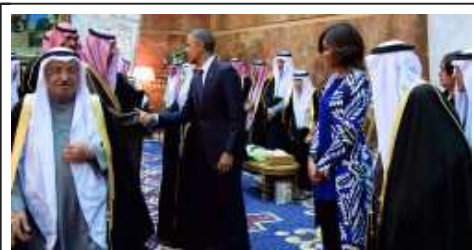
Michelle Obama fue ignorada por la corte del nuevo rey de Arabia Saudí.

Esta semana, hasta los republicanos más acérrimos han mostrado públicamente su apoyo a la primera dama de los EE UU, algo que no han hecho en los siete años de mandato de Obama. ¿Cuál ha sido el motivo? La humillación explícita a la que los miembros de la corte del nuevo rey de Arabia Saudí y varios dignatarios locales la sometieron cuando acompañó a su marido a presentar sus respetos por la muerte del rey Abdalá. El ninguneo comenzó en el aeropuerto y continuó en el Egra Palace. Al menos cincuenta hombres negaron la mano, el saludo y la mirada a la primera dama de los EE UU.