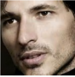
Andrés Velencoso vuelve al cine