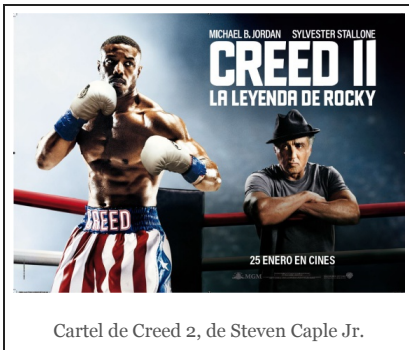
Cartel de Creed 2, de Steven Caple Jr.

Por fin llega a nuestras carteleras la segunda parte de Creed , la nueva saga sobre el mundo del boxeo destinada a formar parte de la filmoteca de los nacidos en los años noventa del pasado siglo.