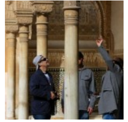
Benicio del toro, un turista en la Alhambra