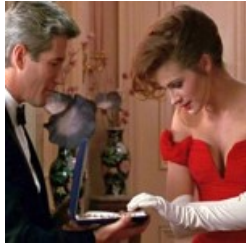
'Pretty Woman' será el nuevo musical de Broadway