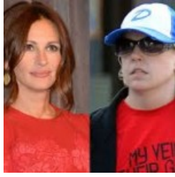
Muere la hermanastra de Julia Roberts por posible sobredosis