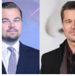
Brad Pitt y Leonardo DiCaprio protagonistas de la nueva película de Tarantino