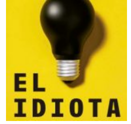
El idiota (Dirección: Gerardo Vera)