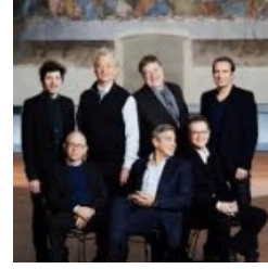
La fotografía prohibida de George Clooney